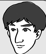
イラスト協力:加藤舞美

「今年の夏はやばい!」と毎年聞きますが、今年は本当に気象異常を感じる夏でした。6月の酷暑に始まり、7月には西日本を中心に豪雨、東から西へ進む台風12号。9月に入っても台風21号による被害が各地で相次ぎ、直後に北海道地震。被災地の復興を願うとともに、平穏な日々感謝し、非常時の備えもしなくてはと身が引き締められました。