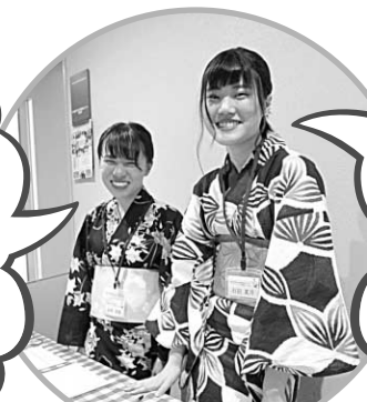
市主催事業「場づくり研修」でのひとコマ

市民の方と職員の距離が近くて相談しやすい環境だなと感じました。職員の方が市民活動をされている人たちのお話を聞いて、知識として情報提供することで、全体をつなげてより多くの方に知ってもらおうという良い循環があると感じました。